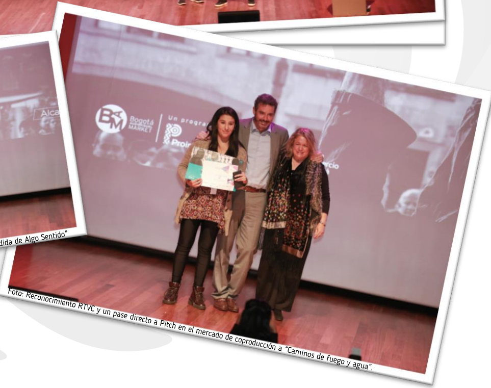
Foto: Reconocimiento RTVC y un pase directo a Pitch en el mercado de coproducción a "Camino de fuego y agua".