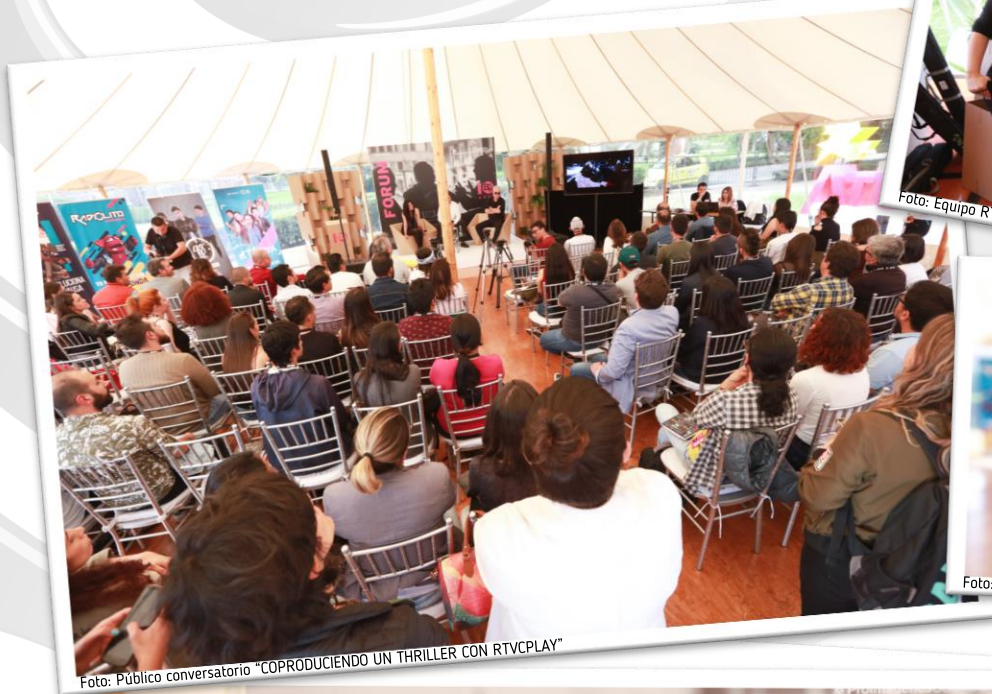
Foto: Público conversatorio “COPRODUCIENDO UN THRILLER CON RTVCPLAY”