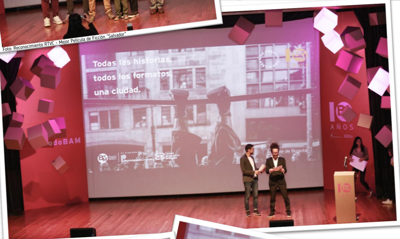
Foto: Clausura BAM 2019