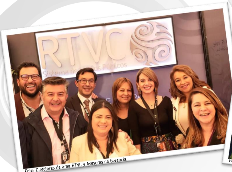
Foto: Directores de área RTVC y Asesores de Gerencia