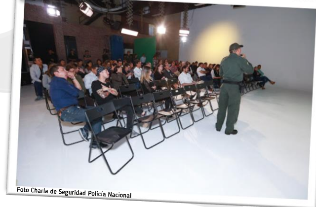
Foto Charla de Seguridad Policía Nacional