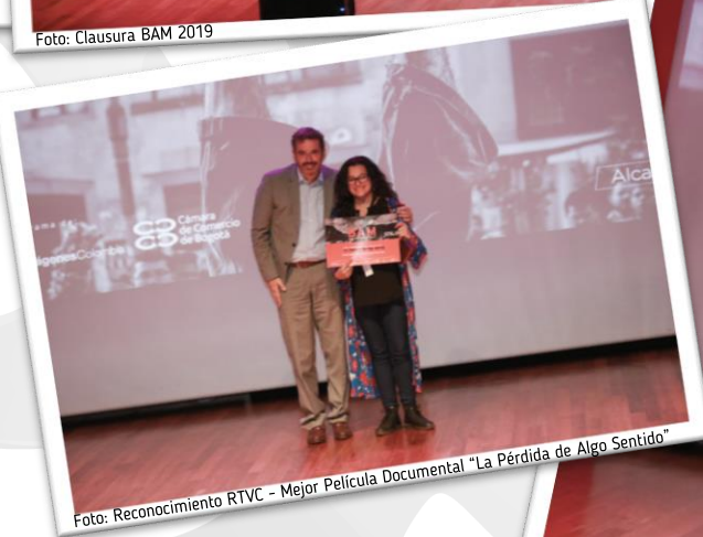
Foto: Reconocimiento RTVC - Mejor Película Documental "La Pérdida de Algo Sentido"