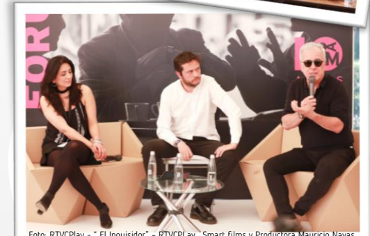
Foto: RTVCPlay - “El Inquisidor” - RTVCPlay, Smart films y Productora Mauricio Navas