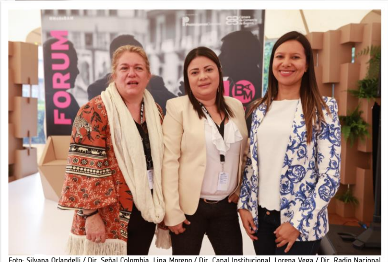
Foto: Silvana Orlandelli / Dir. Señal Colombia, Lina Moreno / Dir. Canal Institucional, Lorena Vega / Dir. Radio Nacional.