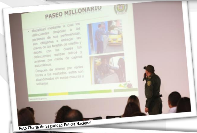
Foto Charla de Seguridad Policía Nacional