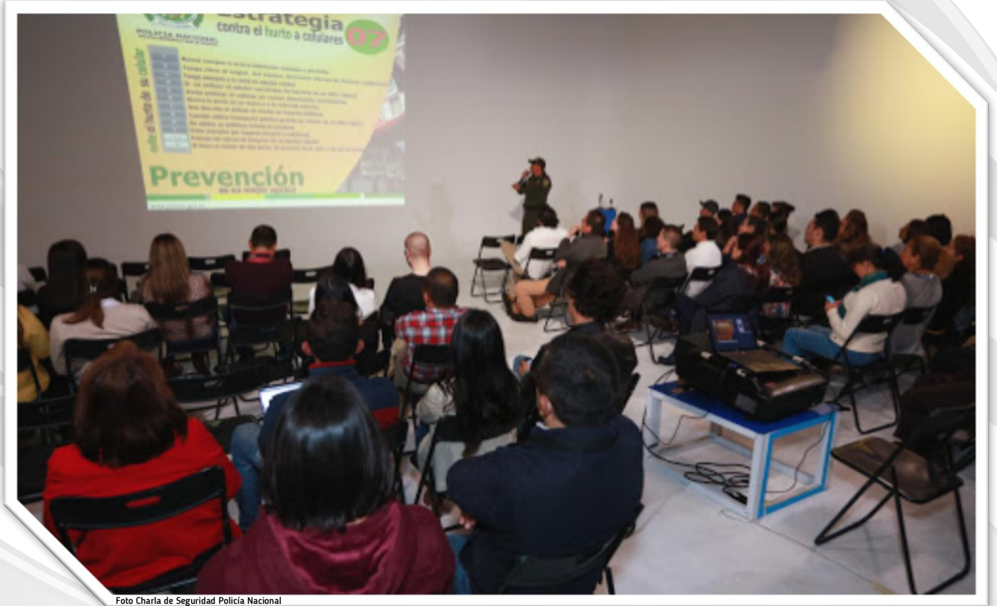
Foto Charla de Seguridad Policía Nacional